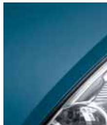
Голубая панорама J43**