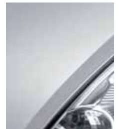
Серое серебро G64**