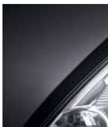
Черные сумерки D68**