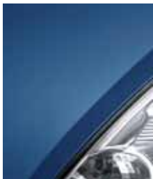
Голубая незабудка V489*