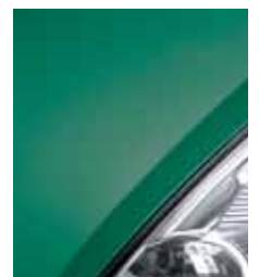
Зеленый океан D92**