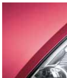
Пунцовая вишня 713**