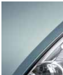
Грозовый серый D47**