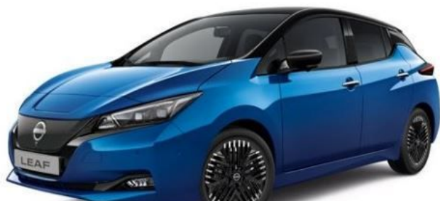
Экстерьер: Magnetic Blue & Black